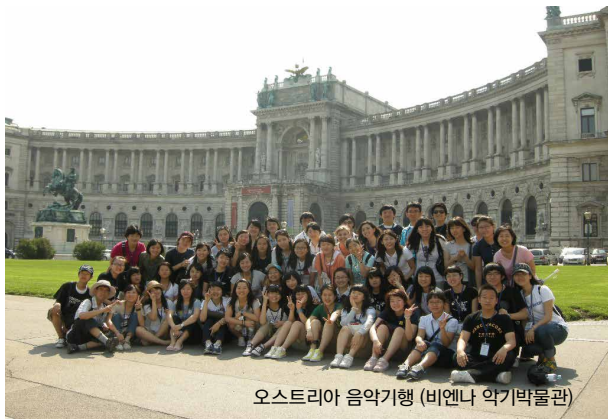
오스트리아 음악기행 (비엔나 악기박물관)