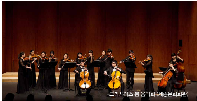
그라시아스 봄 음악회 (세종문화회관)

유럽의 전통적인 음악학교인 컨설바토리(Conservatory)제도를 도입하여 전문화된 교육프로그램으로 실질적이고 체계적인 음악교육에 도전한다.