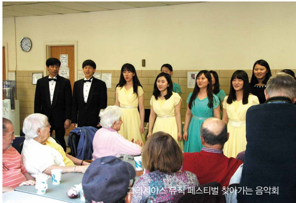
그라시아스 뮤직 페스티벌 찾아가는 음악회