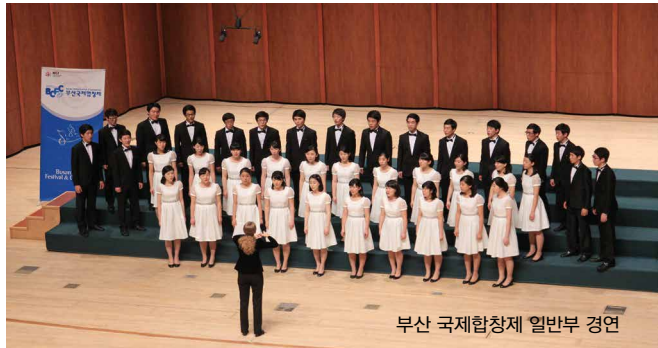
부산 국제합창제 일반부 경연

두 명 이상의 연주자가 호흡을 맞추어 균형과 조화를 이루는 합주 능력을 길러주고, 음악적 공감의 교류를 통해서 풍부한 정서와 조화로운 인격을 형성해준다.