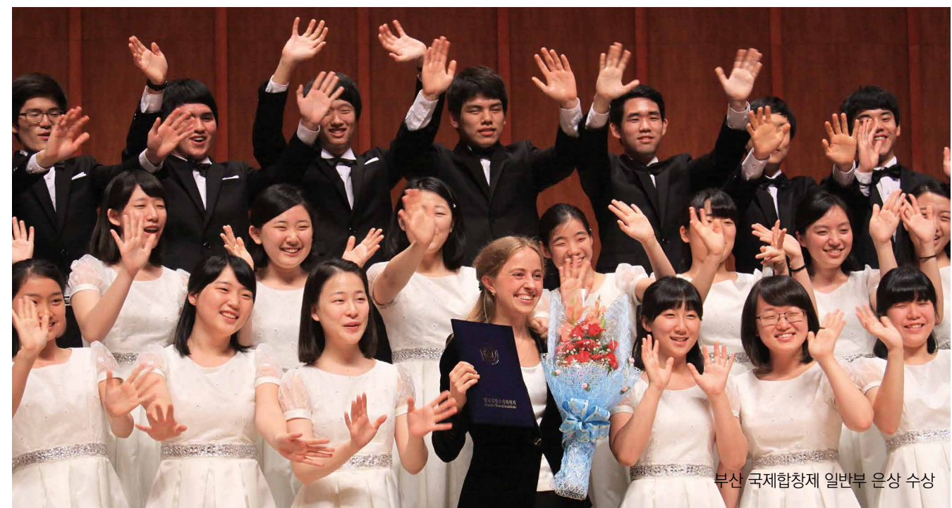
부산 국제합창제 일반부 은상 수상

그라시아스 음악학교는 국내외 정상급 교수진과 능력있고 경험이 풍부한 강사진으로 구성되어 학생 개개인이 무한한 잠재력을 최대한 개발할 수 있도록 훌륭한 음악교육 환경을 제공하고 있다.