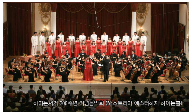
하이트서거 200주년 기념음악회 (오스트리아 에스터하지 하이든홀)

현시대에서 수많은 음악가에 비해 연주할 무대가 없다는 것은 모두에게 공감되는 현실이다. 그라시아스 음악학교 학생들은 다양한 공연을 통해 폭넓은 무대 경험을 쌓고 전문 음악인으로서 갖춰야 할 연주 능력을 기를 뿐 아니라, 음악을 표현할 수 있는 기회를 제공받는다.