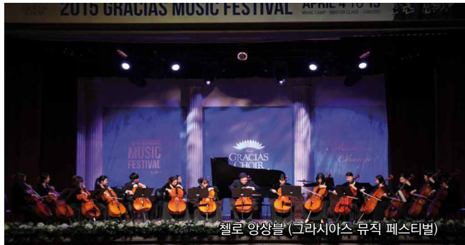
첼로 앙상블 (그라시아스 뮤직 페스티벌)