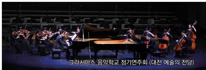
그라시아스 음악학교 정기연주회 (대전 예술의 전당)