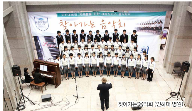
찾아가는 음악회 (인하대 병원)