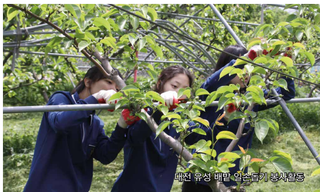
대전 유성 매밭 일손돕기 봉사활동

진정한 음악가가 되기 위해서는 끊임없는 자신과의 싸움이 필요하다. 강한 마음의 세계를 배우기 위해 그라시아스음악학교 학생들은 하루 동안 손에서 음악을 놓고 태안 꽃씨길 50Km걷기, 농촌 봉사 등 다양한 현장 체험 학습 프로그램으로 자신을 극복하고 마음의 깊이를 배워간다.